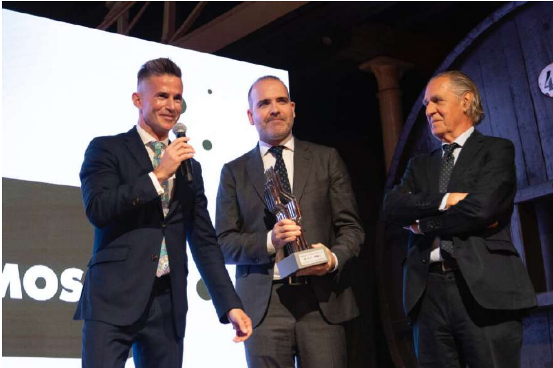
Quesería Vega de Tordín

La sexta generación de esta empresa familiar ha digitalizado la producción y comercialización de un emblema de Asturias como es el queso Cabrales. Esta quesería ha incorporado la sensorización y la robotización a su sistema de producción, utilizando tecnologías avanzadas de blockchain para la trazabilidad del producto en el marco de programas europeos.