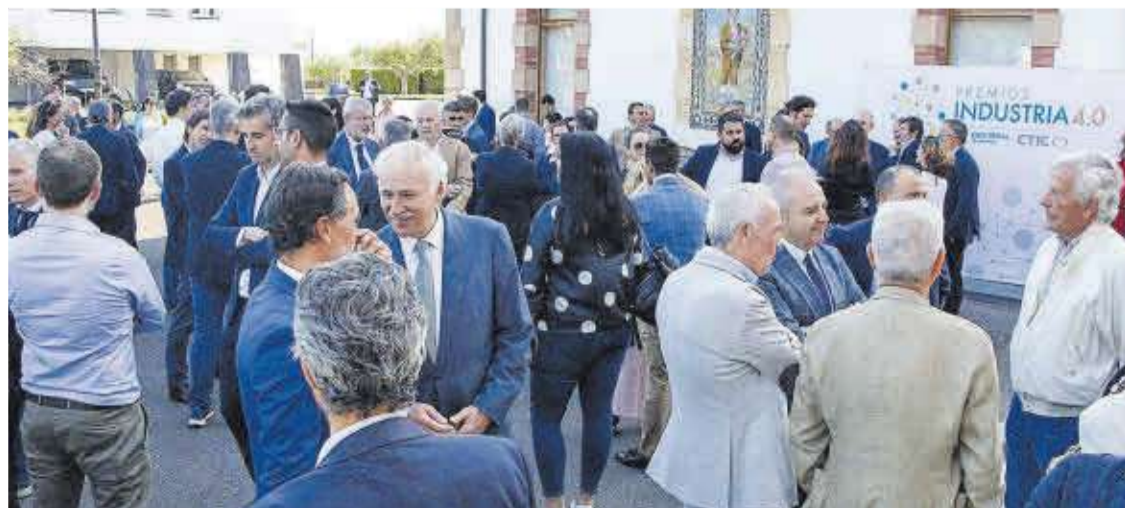
Invitados al acto, en el exterior de la fábrica, en Villaviciosa.