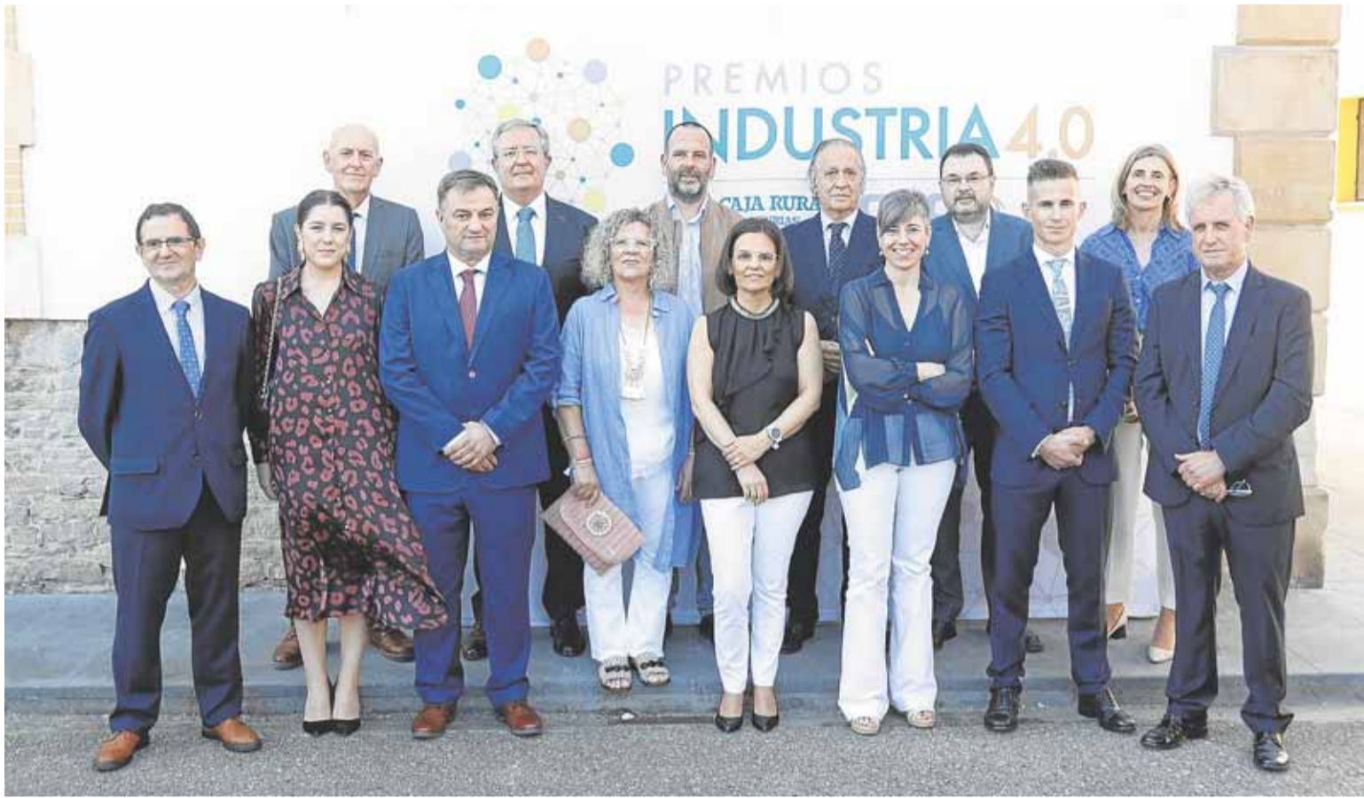
Premiados y jurado posan en las instalaciones de El Gaitero en Villaviciosa antes de comenzar el acto de entrega de premios.