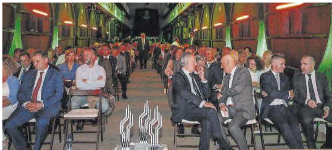
Asistentes al acto celebrado ayer en las instalaciones de El Gaitero. | Alicia García-Ovies

En el caso de la compañía cafetera Toscaf, tener la fábrica digitalizada les ha permitido no solo ser