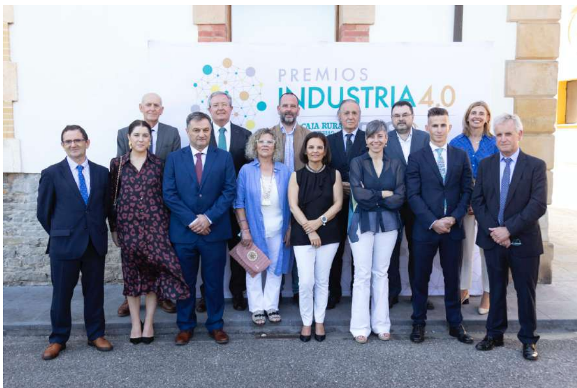
• Ceremonia de entrega de los premios

El galardón reconoce a las empresas asturianas que realizan un importante esfuerzo en el proceso de transformación digital de sus compañías