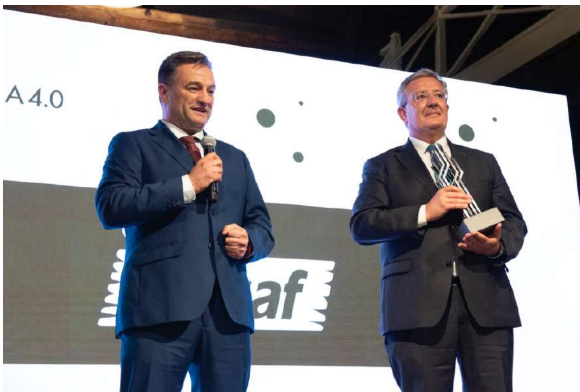
Constructora Los Álamos

El proceso de transformación digital con la incorporación de realidad virtual y aumentada en el desarrollo de sus proyectos fue esencial para que el jurado le concediera a la Constructora Los Álamos el premio en la categoría de «Sector Servicios». Se valoró, además, su importante esfuerzo en la evolución digital en un sector maduro y tradicional como la construcción.