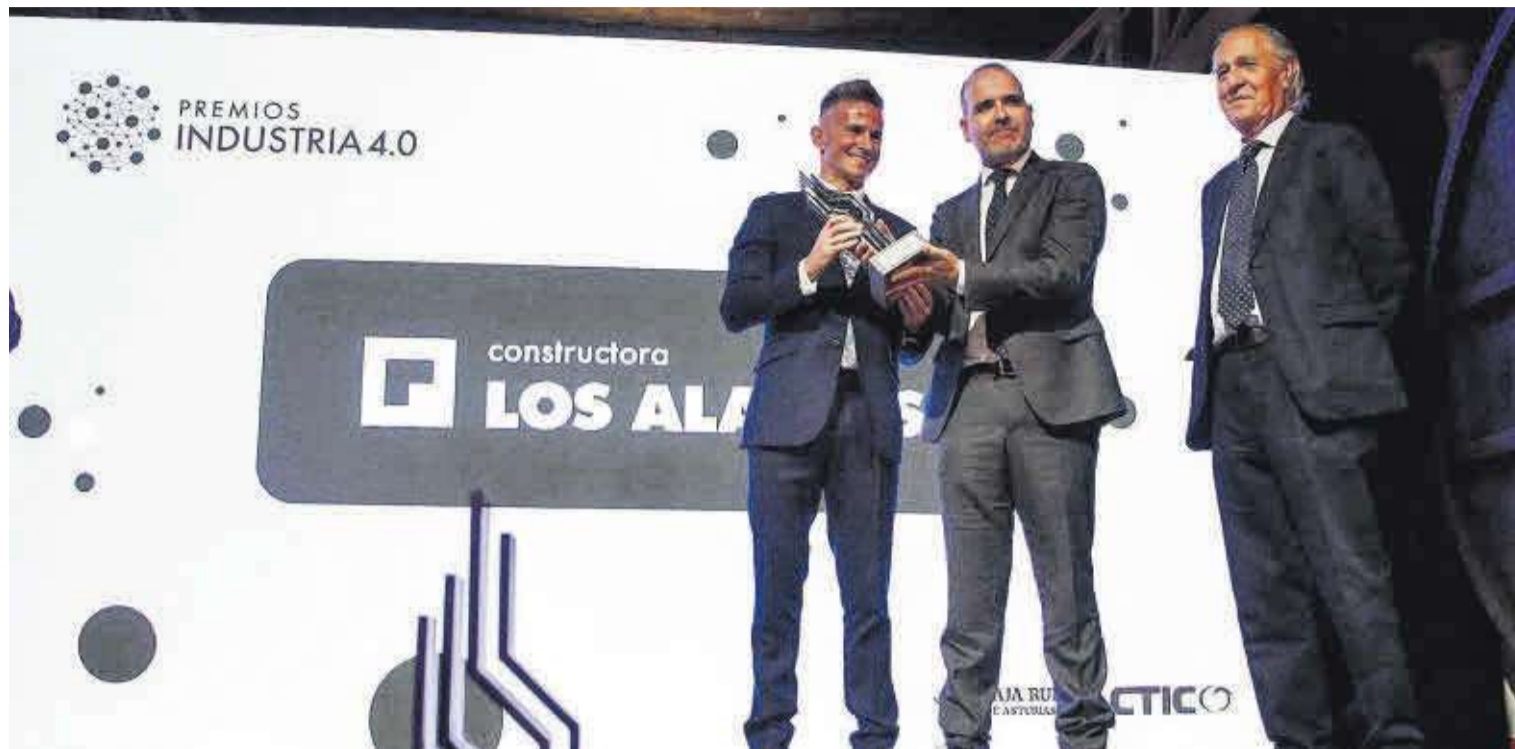
Entrega del premio a Constructora Los Álamos. | Pablo Solares